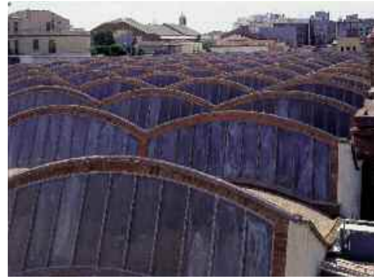
Le Museu Nacional de la Ciència i de la Tècnica, mNACTEC, à Terrassa (Catalogne Centre)

L'essor économique produit par l'industrialisation a entraîné le renouveau artistique et culturel qu'a signifié le Modernisme, la facette catalane de l'Art nouveau. La visite des anciens sites industriels permet une double redécouverte : celle des anciens procédés de fabrication que l'on a préservés jusqu'à nos jours et celle d'une architecture industrielle originale présente partout.