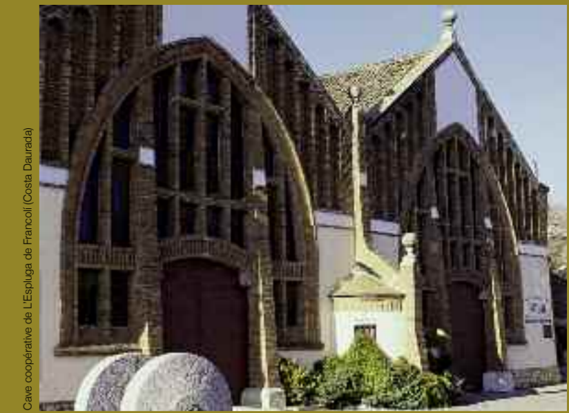
Centre coopératif de l'Espou de França (Costa Daurada)

En Catalogne, culture est synonyme de contacts humains. Concerts et festivals, musées et centres culturels attirent un public de plus en plus nombreux, grâce à des activités conçues pour tous les âges et tous les groupes sociaux. La Catalogne accueille les dernières tendances en muséologie alors même que la culture populaire connaît une période de renouveau. Ce patrimoine vivant est pour les personnes qui nous rendent visite une vitrine de notre pays, qui s'attache à mettre à leur disposition des services adaptés aux différentes façons de voyager.