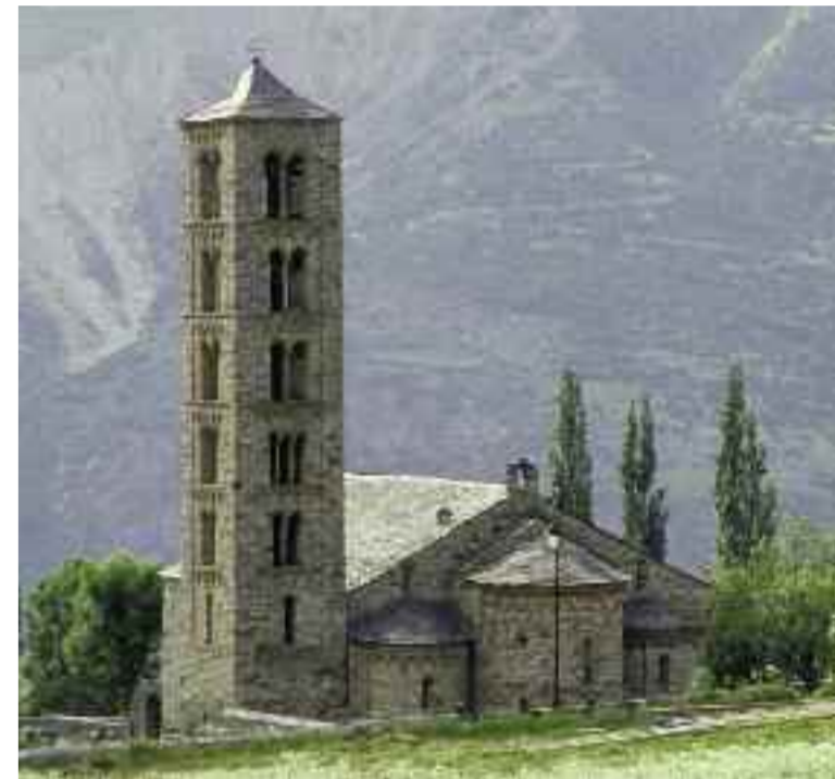
Saint Ciment de Taüll, dans la Vall de Boí (Pirineus)

Un nouveau label touristique consacré aux origines médiévales de la Catalogne. Une traversée des contrées pyrénéennes, depuis le cap de Creus jusqu'à la Vall de Boí, se divisant en deux réseaux principaux et 13 variantes locales qui relient monuments et églises, villes et musées.