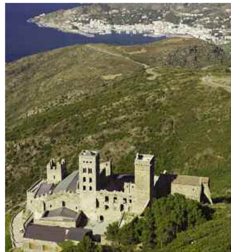
Le monastère Sant Pere de Rodès (Costa Brava)

En Catalogne, le chemin débute au monastère Sant Pere de Rodès, situé dans le parc naturel du cap de Creus. Il passe par Vilabertran, où l'on peut visiter l'église canonique Santa Maria, et il rejoint Le Perthus. À Figueres et Gérone, on peut admirer, en passant, des vestiges du passé médiéval de la région. Montserrat est une autre des étapes importantes. Le Libre Vermell de Montserrat (Livre rouge), du XIV e siècle, est un recueil de chansons de pèlerins. L'ancienne université de Cervera et la Seu Vella (la vieille cathédrale) de Lleida font partie des monuments importants du chemin, lequel est jalonné d'ouvrages d'architecture et d'ensembles monumentaux, ainsi que de beaux espaces naturels, tel l'étang d'Ivars, où se trouve un intéressant observatoire ornithologique. Le chemin prend fin à Alcarràs, où il rejoint la route aragonaise qui se poursuit jusqu'à Logroño.