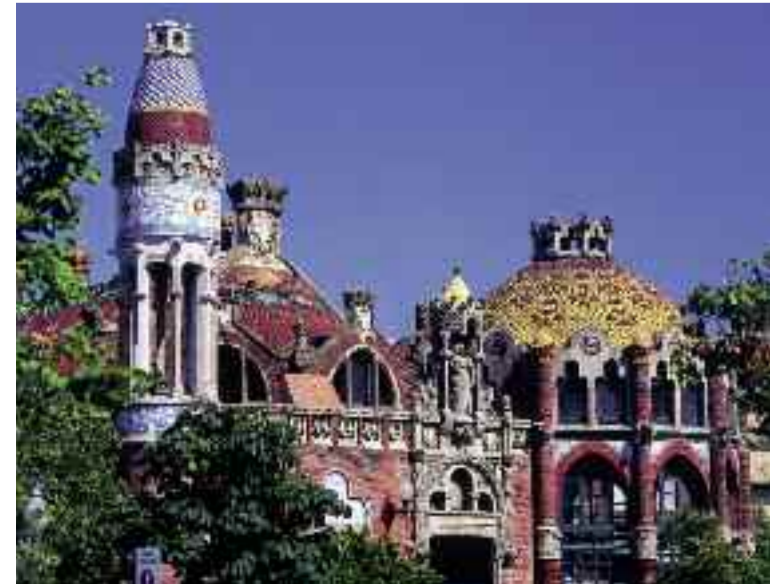
L'Hospital de la Santa Creu i Sant Pau, à Barcelone (Barcelone)

Le « patrimoine mondial de l'Humanité » de l'Unesco est un programme de protection des biens culturels et naturels, dont le but est de préserver, cataloguer et faire connaître des sites considérés comme une partie de l'héritage commun de l'Humanité. Son recensés 851 sites ou manifestations culturelles. La Catalogne possède le plus grand nombre de biens inscrits en Espagne et elle occupe l'un des premiers rangs pour le patrimoine européen. 1984 et 2005. L'œuvre d'Antoni Gaudí à Barcelone. 1991. Le monastère de Poblet. 1997. L'Hospital de Sant Pau et le Palau de la Música Catalana, de Lluís Domènech i Montaner. 1998. Les peintures rupestres de l'arc méditerranéen. 2000. L'ensemble archéologique Tarraco, à Tarragone. 2000. Les églises romanes de la Vall de Boí. 2005. La fête de La Patum de Berga, un chef-d'œuvre du patrimoine oral et immatériel de l'Humanité. 2010. Els Castells (les tours humaines), patrimoine immatériel de l'Humanité. Réserve de biosphère 1978. Montseny 2013. Terres de l'Ebre