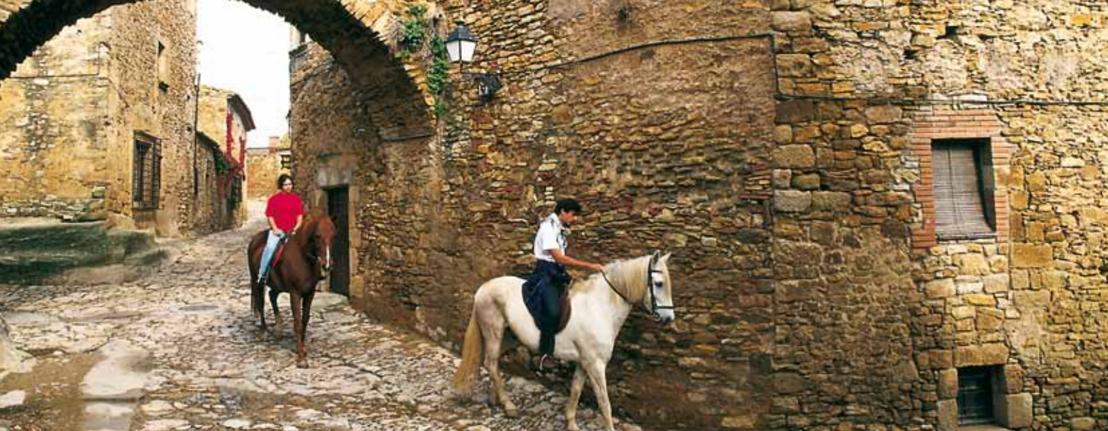
À gauche, activités nautiques à Sitges (Costa de Garraf). En haut, balade à cheval dans le vieux quartier de Forallac (Costa Brava)