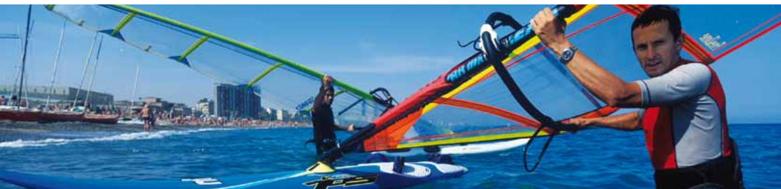
Planche à voile sur la plage d'El Bogatell (Barcelona)