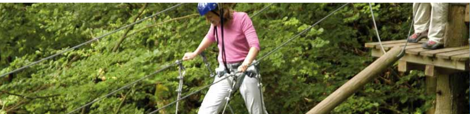
Multi-activités pour tous les âges dans le parc du Montnegre (Costa de Barcelona Maresme)