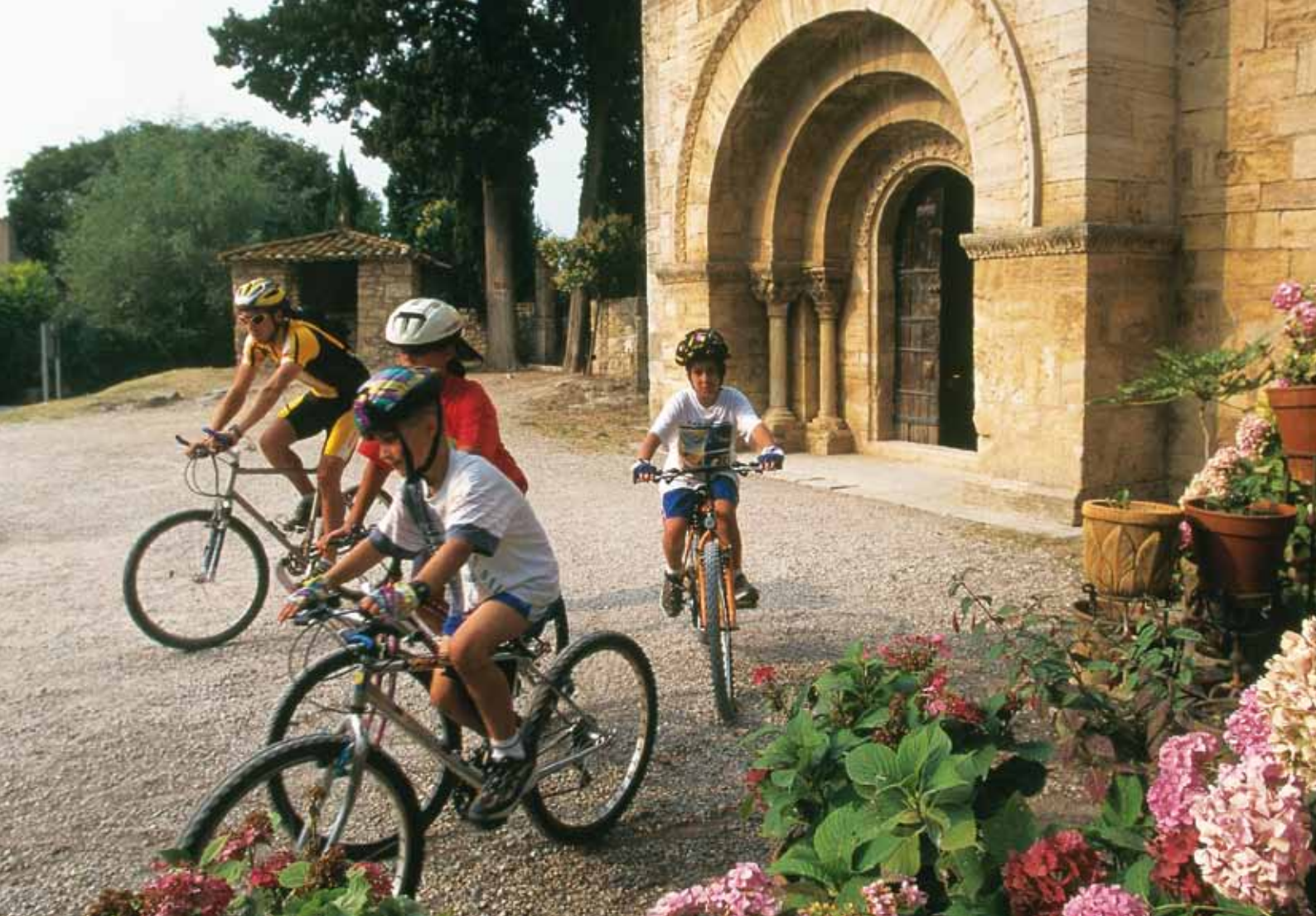
VTT à Banyoles (Costa Brava)