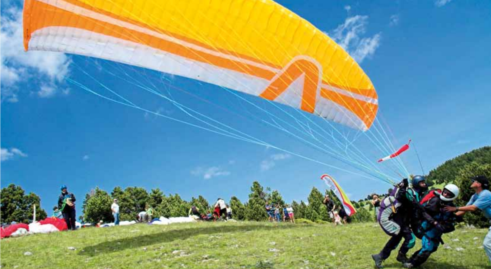
Parapente dans le canton du Berguedà (Pirineus)