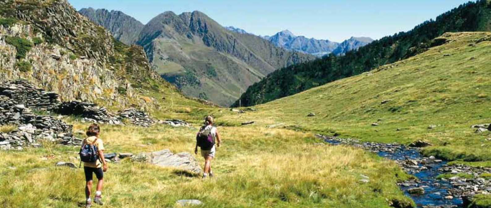
Randonneurs sur le chemin de l'Estany del Diable (Pirineus)